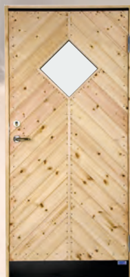
YD 7G BYD 7G