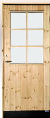
EFD 8G SPE