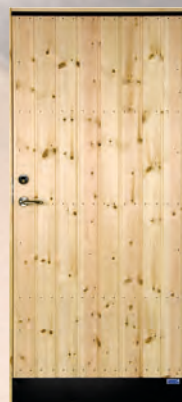
YD 18 BYD 18