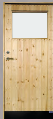
YD 8G BYD 8G