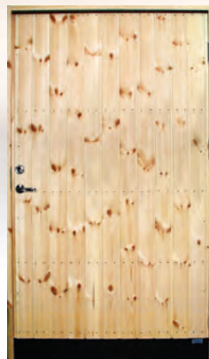
YD 18, BRED