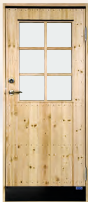
BYD 8G FRÖBO

För övrigt samma uppbyggnad och utrustning som ovan.